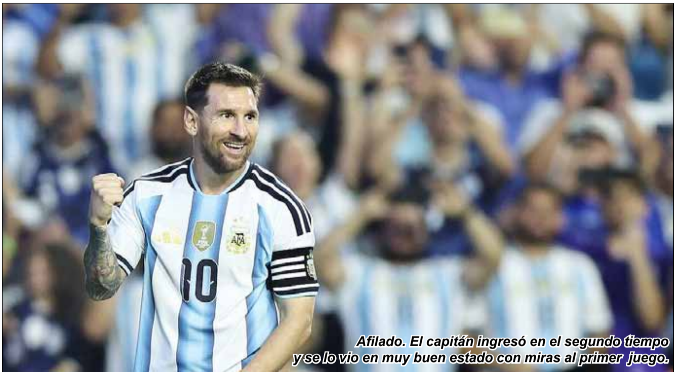
Afilado. El capitán ingresó en el segundo tiempo y se lo vio en muy buen estado con miras al primer juego.

Por el momento, estarían llevándose a cabo las conversaciones preliminares.